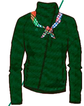
Lancering på Nyborg Strand Kursus 2019.

Det gør vi for at invitere flere med i vores fællesskab , så det ikke bliver en lukket klub, som kun er relevant for de få og ikke de mange, som ville have gavn af at træne deres mod.